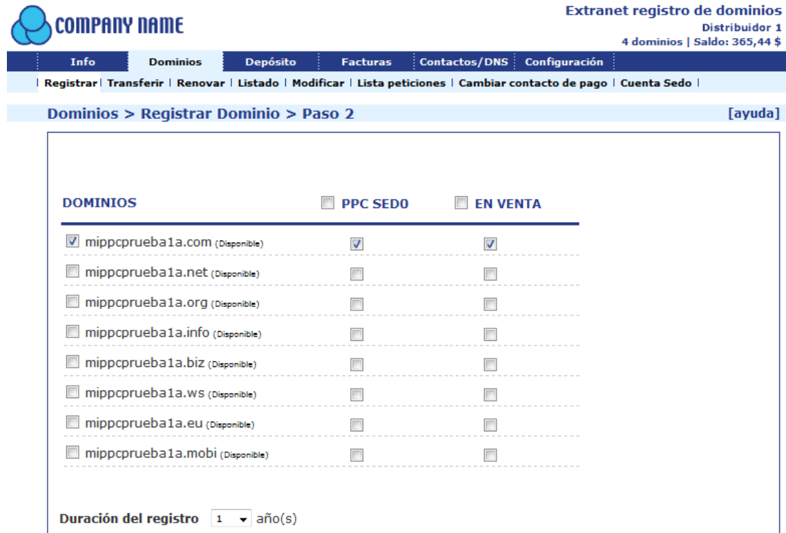
Imagen 1: Asociación de dominios al Parking PPC de Sedo.

Sedo , de la Extranet de Distribuidor ( Ver imagen 2 ). En este último caso se le permite al Distribuidor Asociar/Desasociar dominios al Parking PPC de Sedo de forma masiva o individual.