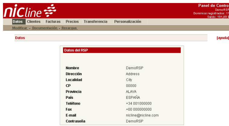
Panel de Control de RSP

El Panel de Control de RSP está destinado a la creación y administración de cuentas de distribuidores e incluye las siguientes funcionalidades: